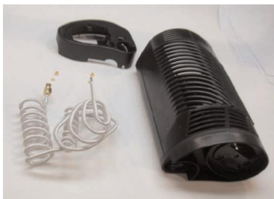
Gehäuse und weiteres Zubehör für LOX-Mobilsysteme und -Vorratsbehälter