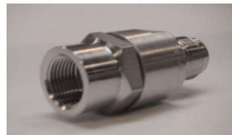
Adapter für Füllschlauch