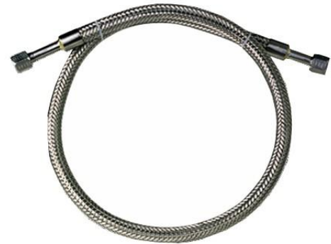
LOX-Füllschlauch in den Varianten