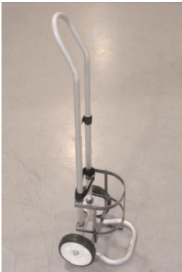
Caddy für LOX-Mobilsysteme