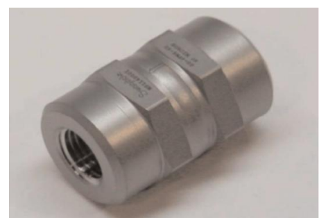
Filter für Füllschlauch